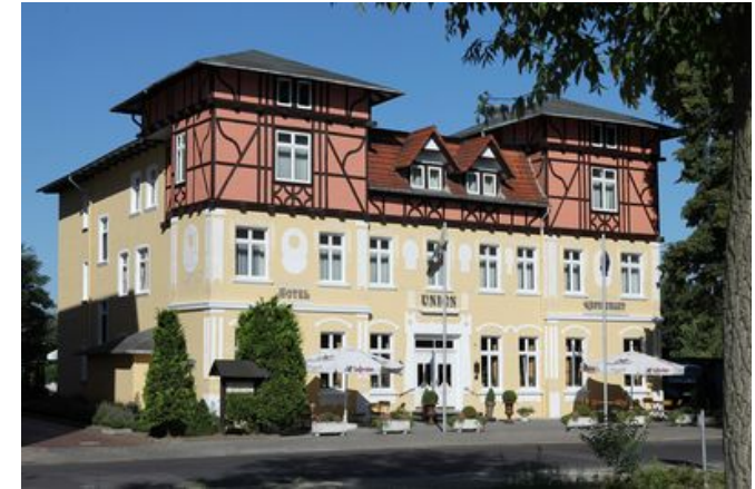
Tagungs Hotel Union